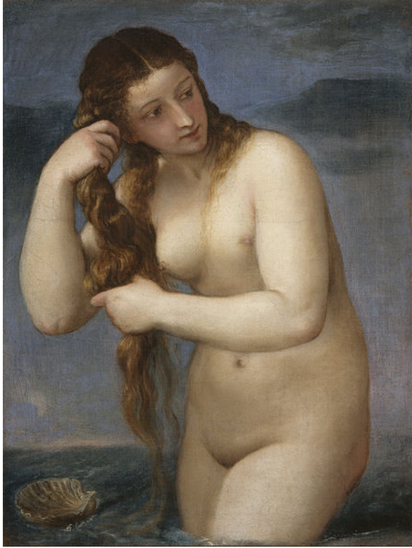
Fig. 5. Tiziano Vecellio, Venus înălțându-se din mare (1520)