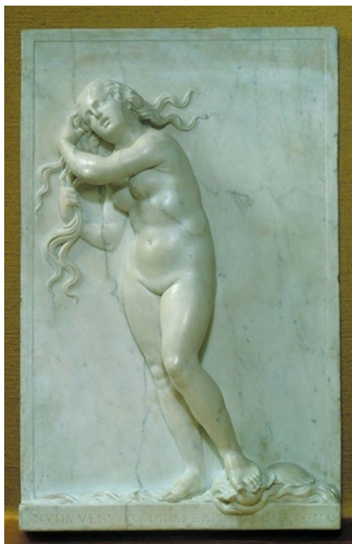
Fig. 4. Antonio Lombardo, Venus Anadyomene (1571-1572) Anadyomene (1480-1516)