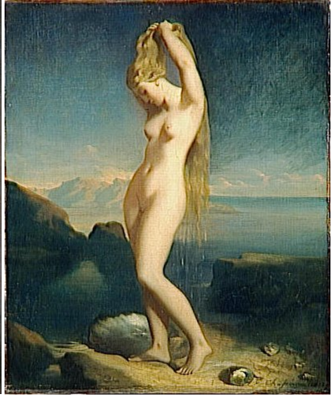
Fig. 6. Théodore Chassériau, Venus Anadyomene (1838)