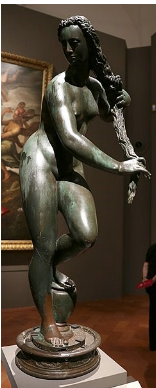
Fig. 3. Giambologna, Venus