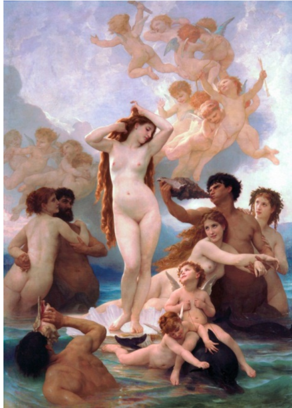
Fig. 10. William-Adolphe Bouguereau, Nașterea lui Venus (1879)