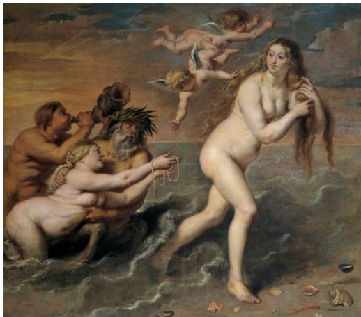
Fig. 7. Cornelis de Vos, Nașterea lui Venus (sec. XVII)