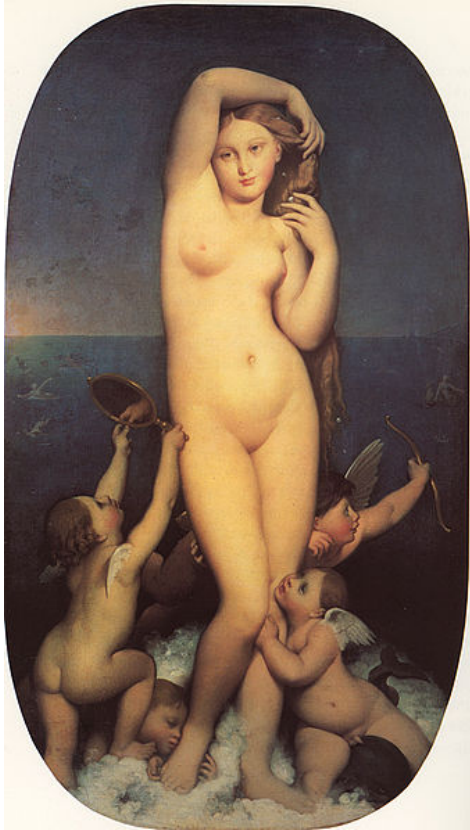
Fig. 9. Jean Auguste Dominique Ingres, Venus Anadyomene (între anii 1808-1848)