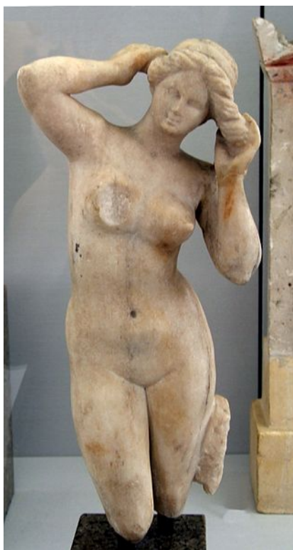
Fig. 2. Anadyomene (sec. II-I î.e.n.)