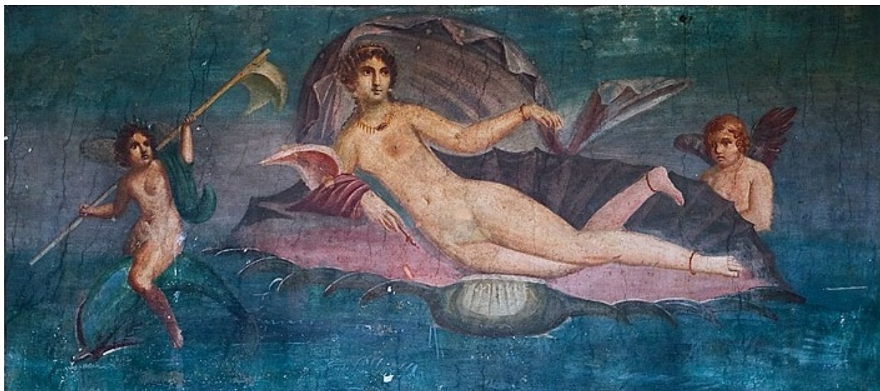
Fig. 1. Afrodita Anadyomene din Pompei (frescă, sec. I e.n.)